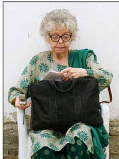
ننسی هچ دوپری